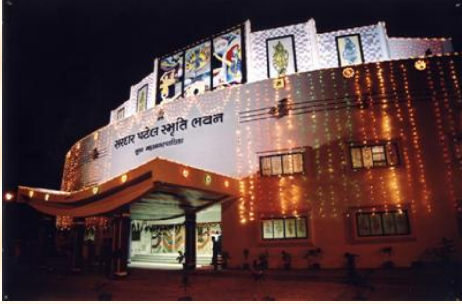
સરદાર પટેલ સ્મૃતિભવન